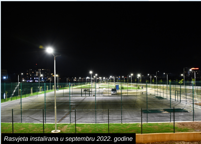
Rasvjeta instalirana u septembru 2022. godine