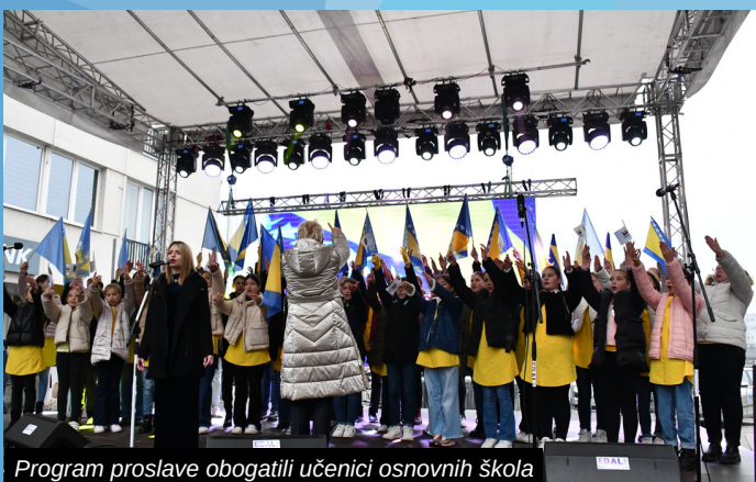
Program proslave obogatili učenici osnovnih škola