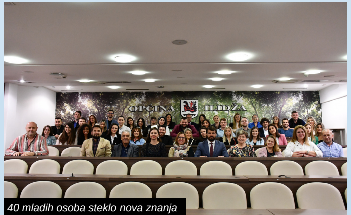
40 mladih osoba steklo nova znanja

Za ove mlade ljude ovaj sastanak i druženje predstavlja samo kraj jednog perioda, a nakon sprovedenog Javnog poziva novi