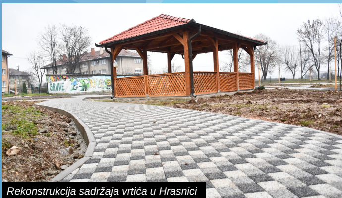
Rekonstrukcija sadržaja vrtića u Hrasnici