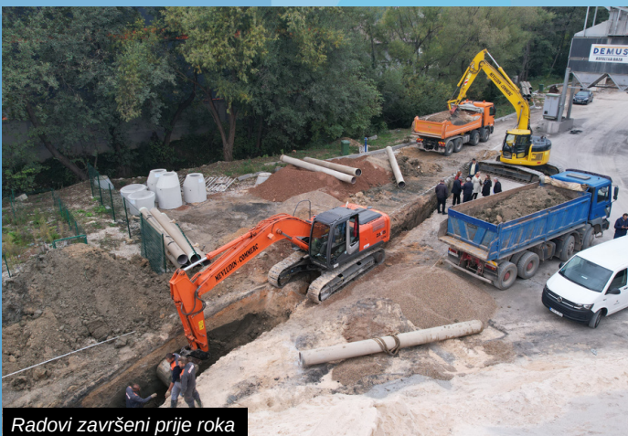
Radovi završeni prije roka

Postavljanjem poklopaca na šahtovima prije roka završeni su radovi na prvoj dionici glavnog kanalizacionog kolektora za Rakovicu, koji je bio jedan od prioriteta Općine Ilidža kada je riječ o infrastrukturnim projektima.