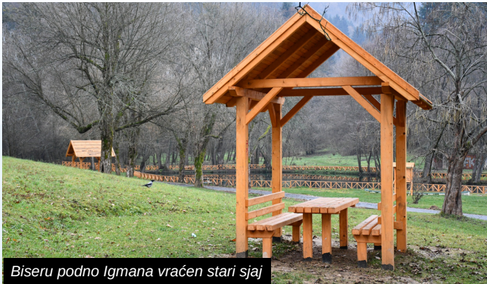
Biseru podno Igmana vraćen stari sjaj

Radovi na obnovi jednog od najpoznatijih izletišta u Kantonu Sarajevo počeli su uklanjanjem stare i dotrajale asfaltne podloge na saobraćajnicama unutar kompleksa, nastavljani su radovima na saobraćajnicama koje vode ka izletištu kao i ambijentalnim uređenjem ovog lokaliteta.