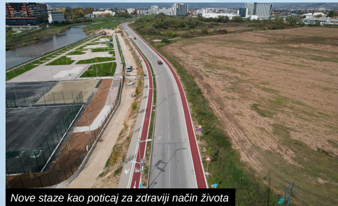
Nove staze kao poticaj za zdraviji način života

Izgradnjom biciklističkih staza Općina Ilidža nastoji potaknuti, kako građane Ilidže tako i turiste, na zdraviji način života. Od ranije je poznato da povećavanjem intenziteta korištenja ovog prevoznog sredstva utječe se i na smanjenje emisije štetnih gasova. Kroz plan razvoja općine Ilidža nazvan "Ilidža, dom dobrih ljudi" planiran je niz ovakvih projekata i u budućnosti.