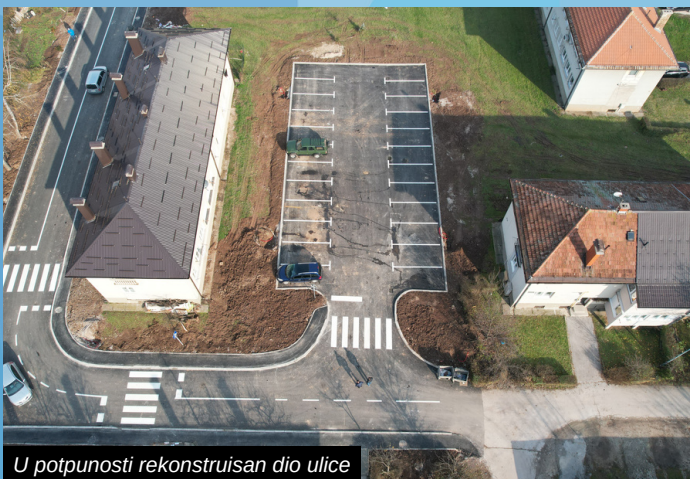
U potpunosti rekonstruisan dio ulice

Povoljni vremenski uslovi pogodovali su produženju građevinske sezone na području općine Ilidža u finišu 2022. godine, a zahvaljujući njima realizovana je potpuna rekonstrukcija jednog dijela ulice Sabita Užičanina, kao i izgradnja novog parking prostora za stanovnike.