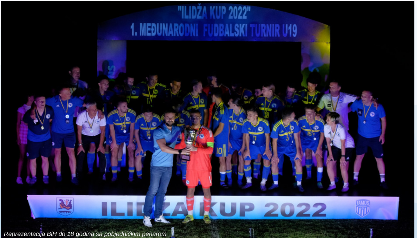
Reprezentacija BiH do 18 godina sa pobjedničkim peharom