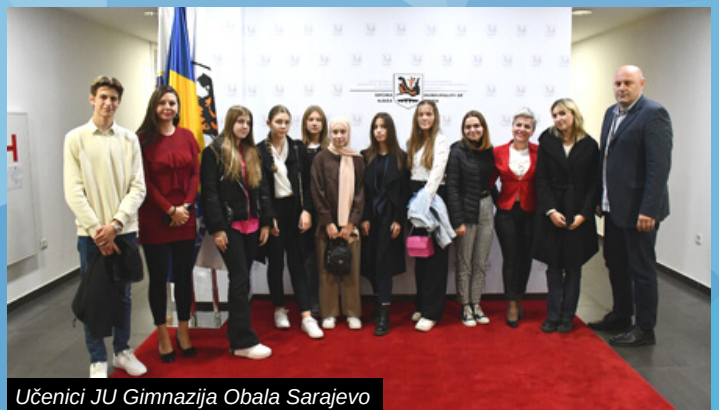
Učenici JU Gimnazija Obala Sarajevo

Jednodnevno volontiranje u Općini Ilidža učenici su iskoristili i kako bi stekli osjećaj radne atmosfere i dodatno se upoznali s procesima koji se odvijaju u radu općinskih službi. Srednjoškolci su naglasili da su se osjećali izuzetno prijatno i prihvaćeno tokom radnog dana u Općini Ilidža.