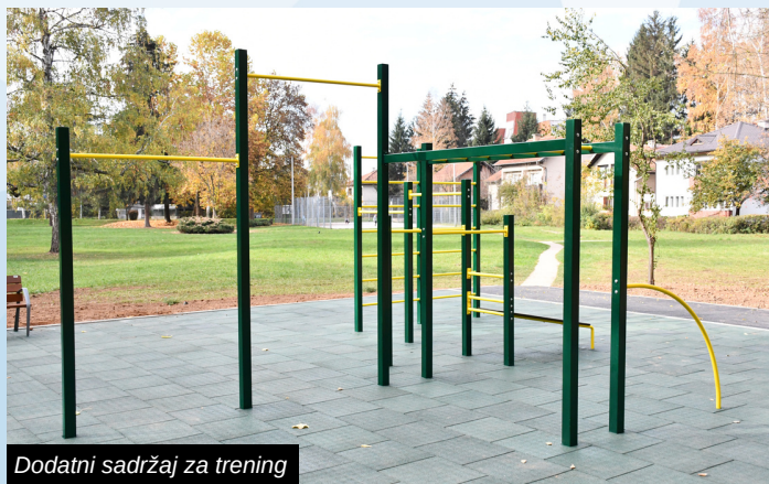
Dodatni sadržaj za trening