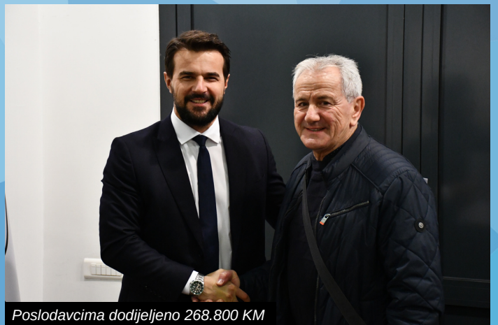
Poslodavcima dodijeljeno 268.800 KM

Načelnik Muzur je naglasio kako je ovaj program jedan od onih