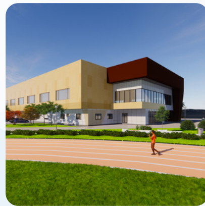
Sportska dvorana Hrasnica