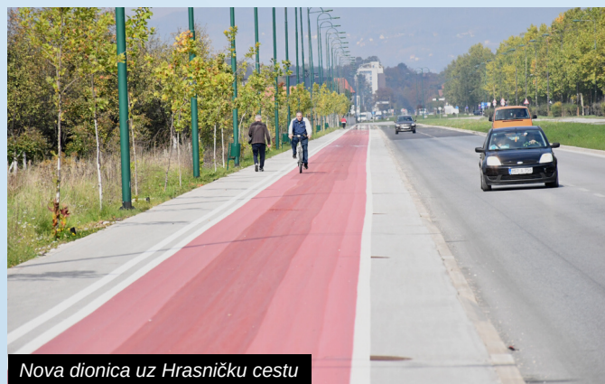
Nova dionica uz Hrasničku cestu

Općina Ilidža dobila je nove dionice biciklističke staze. Nova biciklistička staza, koja je još jedan segment plana razvoja općine Ilidža, prostire se ulicom Hrasnička cesta, od kružnog toka u Sokolović Koloniji do kružne raskrsnice u Hrasnici.