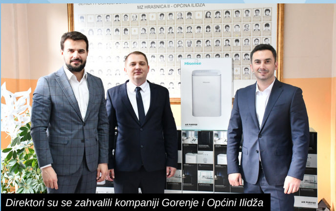
Direktori su se zahvalili kompaniji Gorenje i Općini Ilidža

"Green Star" za održivi razvoj i klimatske akcije. Održivi principi su čvrsto ugrađeni u misiju, viziju, strategiju i poslovne modele Hisense Europe. Gorenje je odlikovano sa četiri zvjezdice što ga svrstava u kategoriju "Zeleni lider".