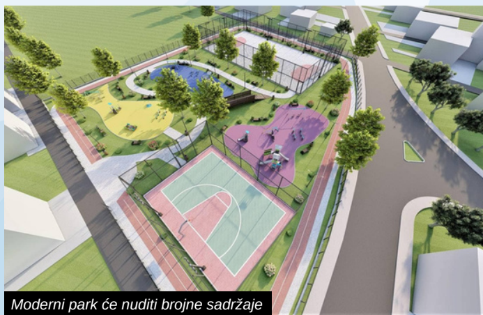
Moderni park će nuditi brojne sadržaje