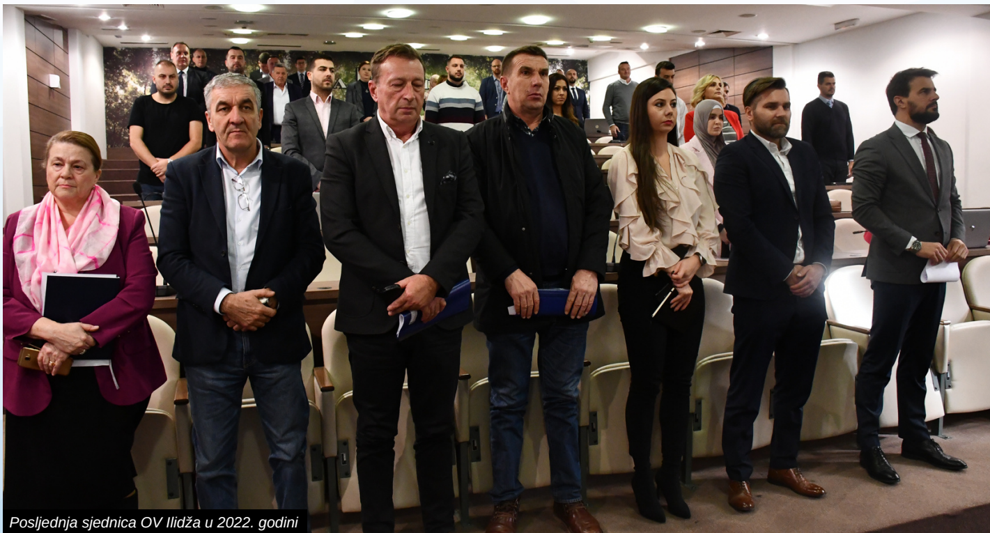
Posljednja sjednica OV Ilidža u 2022. godini