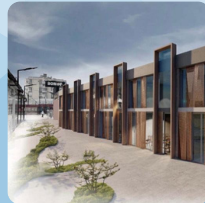
Uređenje centralnog dijela Ilidže