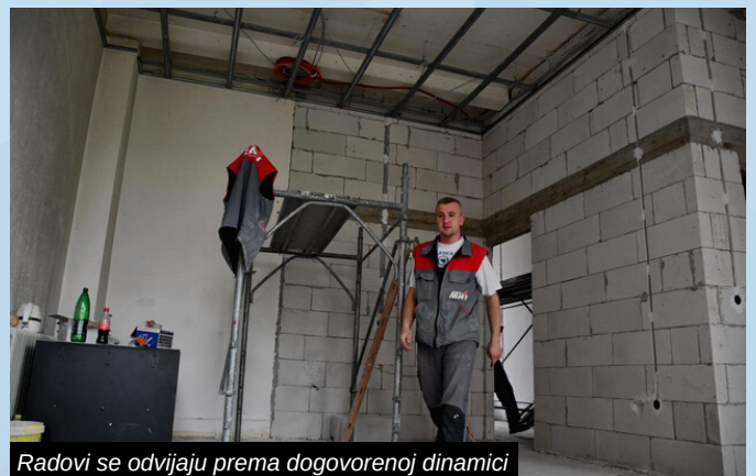
Radovi se odvijaju prema dogovorenoj dinamici

Naši najstariji sugrađani ubrzo će u centru Ilidže (Mjesna zajednica Lužani) imati prostor u kojem će moći uživati.