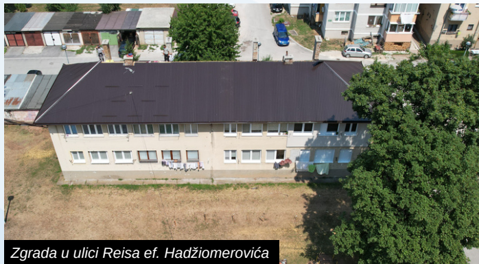
Zgrada u ulici Reisa ef. Hadžimerovića

U vrlo kratkom periodu kroz projekte nužnih popravki Općina Ilidža sanirala je krovove na četiri zgrade kolektivnog stanovanja, a koji su bili u izuzetno lošem stanju. Zgrada u ulici Reisa ef. Hadžimerovića jedna je od onih na kojoj je postavljen novi krov, a prethodno su krovovi promijenjeni i na zgradama koje se nalaze u ulicama 15. maj i Sabita Užičanina.