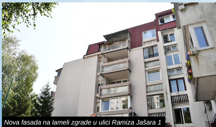
Nova fasada na lameli zgrade u ulici Ramiza Jašara 1

Istovremeno, Općina Ilidža je radila i na utopljanju objekata kolektivnog stanovanja, a uspješno su okončani radovi na novoj fasadi na jednoj od lamela u ulici Ramiza Jašara.