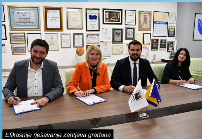
Efikasnije rješavanje zahtjeva građana

Ilidža je prva općina u Bosni i Hercegovini koja je spremna na potpunu digitalizaciju od koje će najviše profitirati građani.