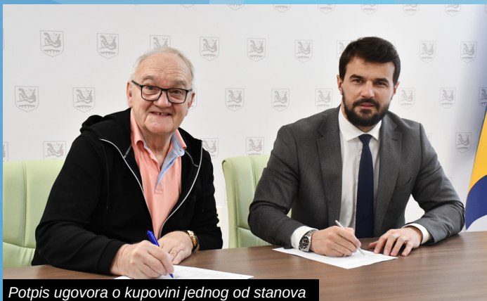
Potpis ugovora o kupovini jednog od stanova

- S ponosom mogu reći da smo potpisivanjem ugovora o kupovini dva stana koji se nalaze u Staroj željezničkoj stanici napravili važan korak u smjeru koji nas vodi ka rekonstrukciji