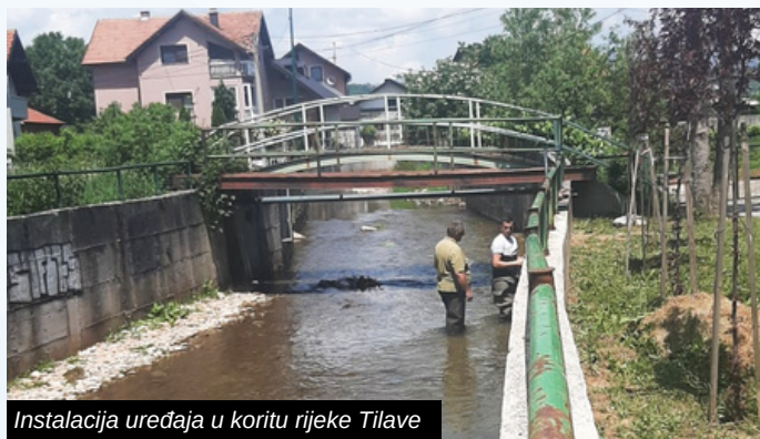
Instalacija uređaja u koritu rijeke Tilave

Mjerno mjesto će umnogome pomoći preventivno djelovanje na kritičnim mjestima vodotoka.