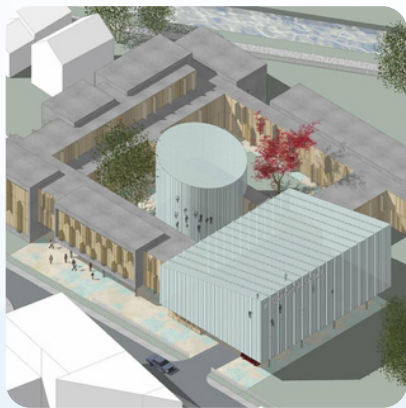
Osnovna škola Stup