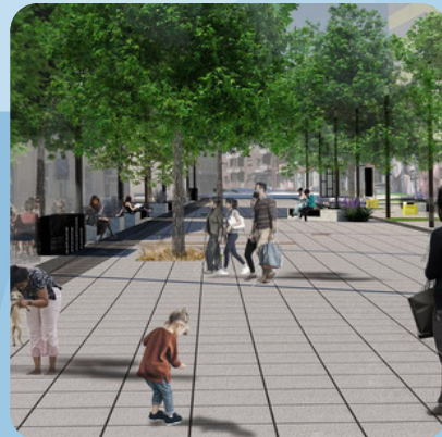
Trg "Sabit Hadžić"