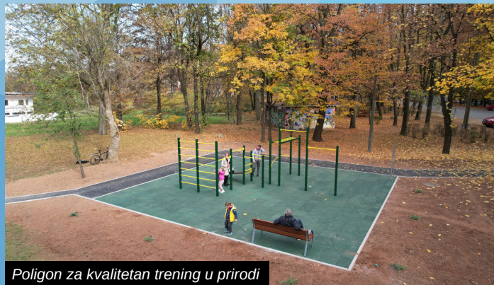
Poligon za kvalitetan trening u prirodi

Izgradnjom Street workout parka svi koji dolaze trenirati u Veliku aleju dobit će sadržaj kroz koji će imati priliku da unaprijede svoj trening u prirodnom okruženju. Na realizaciji ovog projekta Općine Ilidža bilo je angažovano Javno preduzeće Ilidža, koje je sredinom 2022. godine sa sličnim Street workout parkom oplemenilo sadržaj na izletištu Stojčevac.