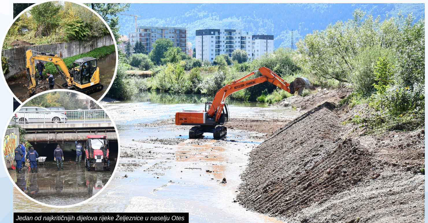
Jedan od najkritičnijih dijelova rijeke Željeznice u naselju Otes

Nakon čišćenja korita, Općina Ilidža nastavila je s radovima na utvrđivanju obale rijeke Željeznice.