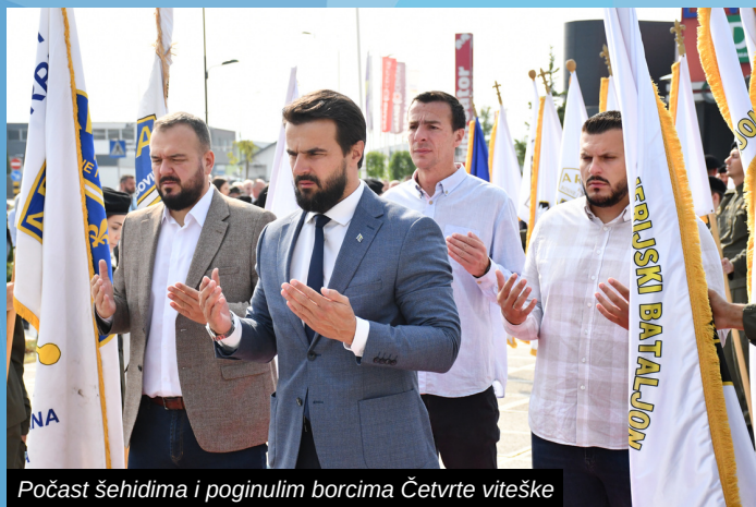
Počast šehidima i poginulim borcima Četvrtе viteške

Čuvari kapije glavnog grada, kako je ilidžansku brigadu jednom