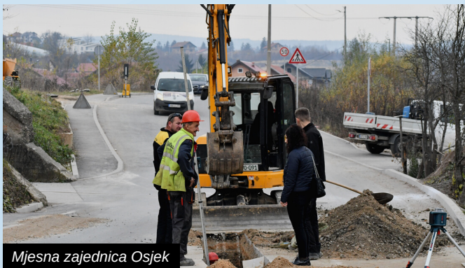
Mjesna zajednica Osjek

Projekt polaganja kanalizacije u ulici Hendekuša (Mjesna zajednica Osjek), čija je realizacija počela sredinom novembra 2022. godine, u punom je jeku. Radovi na ovom infrastrukturnom projektu odvijaju se unaprijed određenom dinamikom.