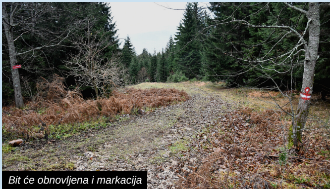
Bit će obnovljena i markacija

U saradnji s Vladom Kantona Sarajevo, Općina Ilidža je 2022. godine krenula u obnovu ratnog puta preko Igmana. Nova saobraćajna komunikacija u budućnosti će kroz teritoriji FBiH spojiti Ilidžu i Sarajevo sa ostatkom Igmana i Bjelašnicom.