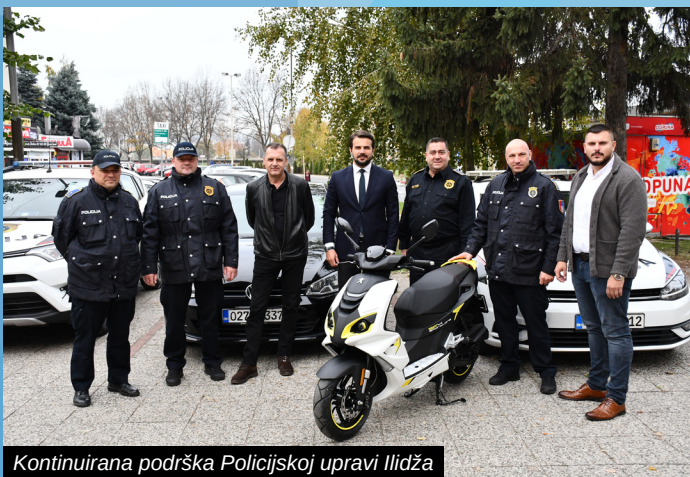
Kontinuirana podrška Policijskoj upravi Ilidža

U želji da sigurnosni aspekt bude na visokom nivou, Općina Ilidža nastavila je s kontinuiranom podrškom Policijskoj upravi Ilidža kojoj je isporučen skuter kao priprema za narednu sezonu.