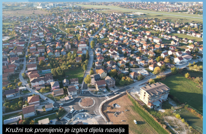
Kružni tok promijenio je izgled dijela naselja