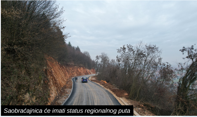
Saobraćajnica će imati status regionalnog puta

Krajem 2022. godine asfaltirana je dionica ratnog puta na Igmanu, koji je zajednički projekt Ministarstva saobraćaja Kantona Sarajevo, Općine Ilidža i Direkcije za puteve Kantona Sarajevo.