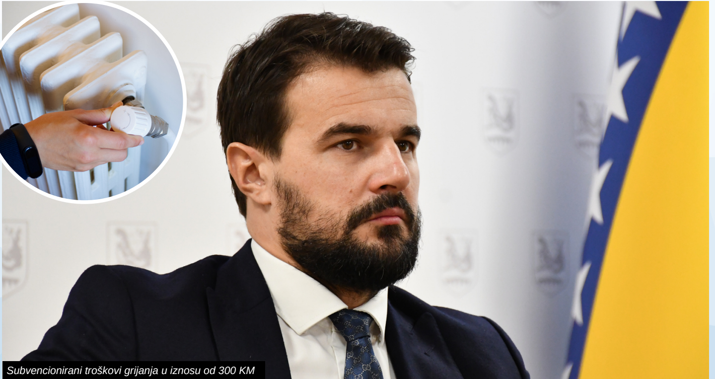
Subvencionirani troškovi grijanja u iznosu od 300 KM

Načelnik Općine Ilidža Nermin Muzur donio je Odluku o isplati novčanih sredstava kojima su subvencionirani troškovi grijanja u iznosu od 300 KM za više od 2.300 domaćinstava s područja Općine Ilidža, a ovoj Odluci prethodio je Zaključak kojeg je usvojilo Općinsko vijeće Ilidža na 19. redovnoj sjednici.