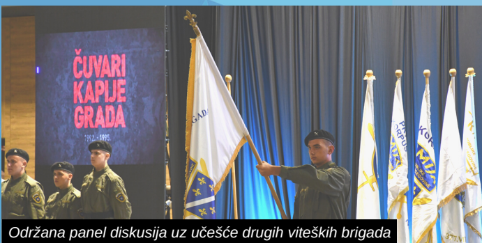
Održana panel diskusija uz učešće drugih vitezkih brigada

- Kada smo razgovarali o manifestaciji i obilježavanju 30. godišnjice i kada su predstavnici Četvrte vitezke motorizovane brigade došli na prvi sastanak s prijedlogom projekta, imao sam nekoliko uslova. Ova manifestacija mora biti iznad svega, da ne smije biti politizirana, da je niko ne smije svojatati, da mora biti naša i na najboljem mogućem organizacijskom nivou - poručio je Muzur, uz posebnu poruku hrabrim i čestitim borcima Četvrte vitezke, koji su predmeti montiranih procesa, da nikada neće biti sami.