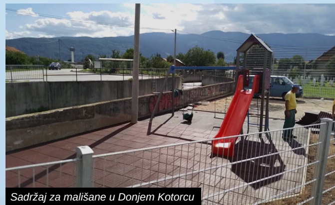
Sadržaj za mališane u Donjem Kotorcu

Obnovom postojećih i izgradnjom novih dječjih igrališta i sportskih ploha, uz izgradnju Sportsko rekreativnog centra za djecu i mlade na obali Željeznice, Općina Ilidža nastoji mjesta za igru najmlađih naraštaja učiniti što sigurnijim.