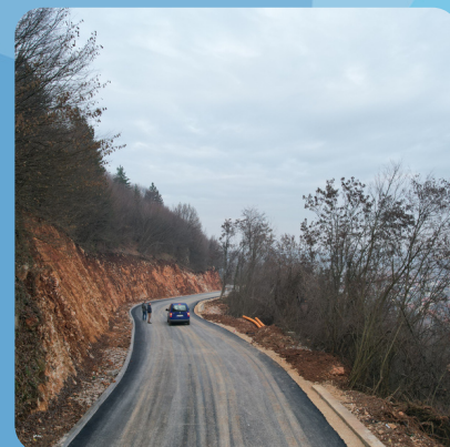
Ratni put preko Igmana