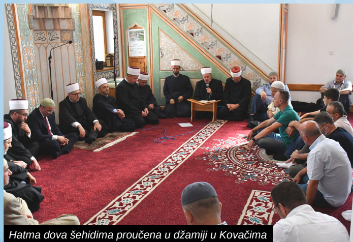
Hatma dova šehidima proučena u džamiji u Kovačima

muzike" poslana je jasna poruka da žrtva onih koji su sebe trajno ugradili u temelje Bosne i Hercegovine nikada neće biti zaboravljena.