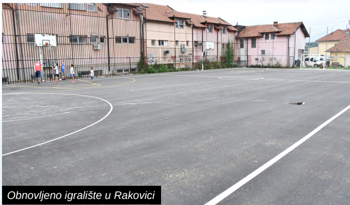
Obnovljeno igralište u Rakovici