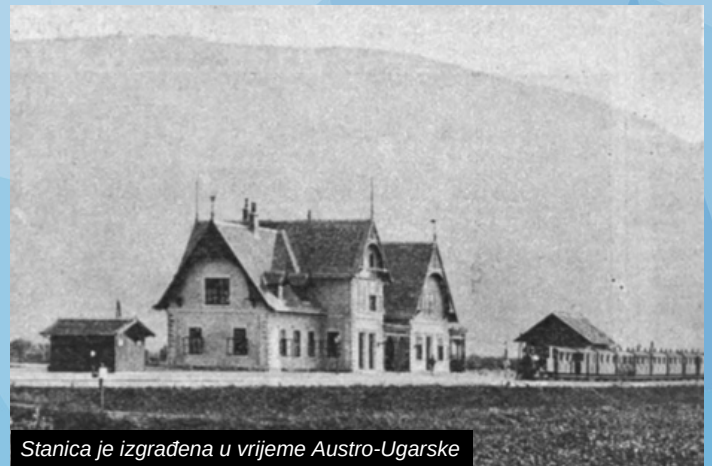
Stanica je izgrađena u vrijeme Austro-Ugarske

jednog od nacionalnih spomenika na području naše općine, koji je također i jedan od najprepoznatljivijih objekata na teritoriji Ilidže - rekao je Nermin Muzur načelnik Općine Ilidža.