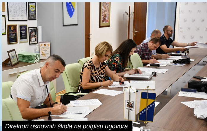
Direktori osnovnih škola na potpisu ugovora