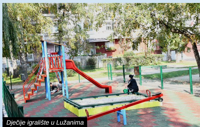
Dječije igralište u Lužanima

Dječije igralište i sportska ploha u Mjesnoj zajednici Lužani obnovljeno je u potpunosti. Pored novog mobilijara na dječijem igralištu postavljena je gumirana podloga koja će najmlađim posjetiocima pružiti dodatnu sigurnost. Pored toga instalirana je i zaštitna ograda, a asfaltirane su i obje staze uz samo igralište.