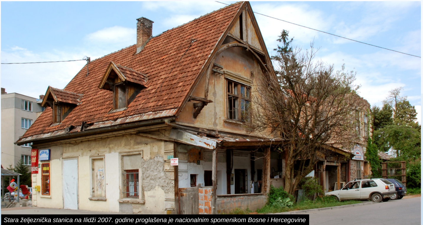
Stara željeznička stanica na Ilidži 2007. godine proglašena je nacionalnim spomenikom Bosne i Hercegovine

Stara željeznička stanica na Ilidži izgrađena je 1892. godine, kada je Ilidža dobila lokalnu prugu dužine 1,3 kilometra na relaciji Ilidža - Banja Ilidža, a koja je bila povezana s prugom Sarajevo - Metković