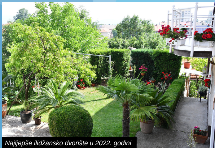
Najljepše ilidžansko dvorište u 2022. godini

S ciljem očuvanja tradicije ilidžanskih bašti, ali i podizanja svijesti građana o značaju očuvanja životne sredine i poboljšanja turističke ponude, Općina Ilidža je dvanaestu godinu zaredom, organizovala izbor najljepšeg dvorišta i balkona s cvjetnim aranžmanom.