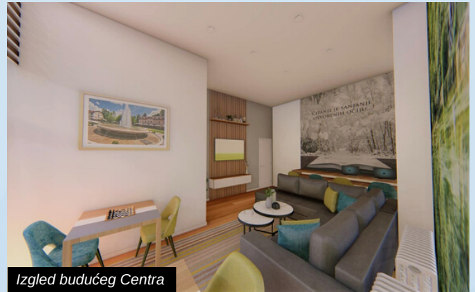
Izgled budućeg Centra

Iako je Općina Ilidža u 2022. godini predano radila na realizaciji projekata koji se tiču najmlađih stanovnika naše lokalne zajednice, ni oni najstariji nisu zaboravljeni.