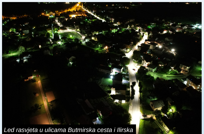
Led rasvjeta u ulicama Butmirska cesta i Ilirska

- Nastojali smo u svakoj mjesnoj zajednici u nekoliko ulica instalirati LED rasvjetu, a tamo gdje smo stali 2022.