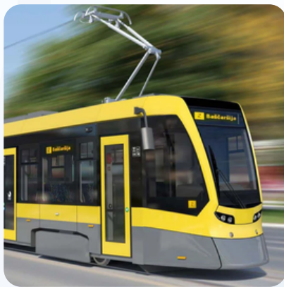
Tramvajska pruga Ilidža - Hrasnica