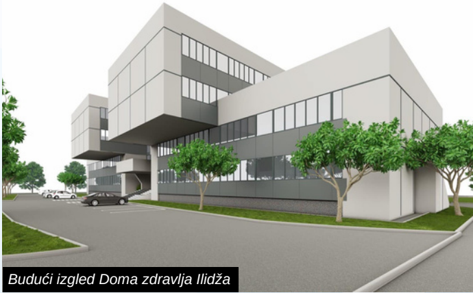
Budući izgled Doma zdravlja Ilidža

Načelnik Općine Ilidža Nermin Muzur i ministar komunalne privrede, infrastrukture, prostornog uređenja, građenja i zaštite okoliša Kantona Sarajevo Enver Hadžiahmetović obišli su Dom zdravlja Ilidža i prisustvovali početku radova na prvoj fasadi objekta, a koji se implementiraju kroz projekt "Energijska efikasnost u javnim objektima KS".