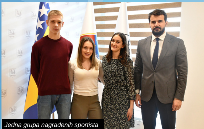
Jedna grupa nagrađenih sportista

- Ovi uspješni mladi ljudi istinski su ponos naše lokalne zajednice. Iskreno se nadam da će već u bližoj budućnosti pokazati svo znanje i potencijal koji posjeduju, a uvjeren sam da će kroz budući rad i angažman širiti pozitivnu priču o našoj Ilidži - kazao je načelnik Muzur.