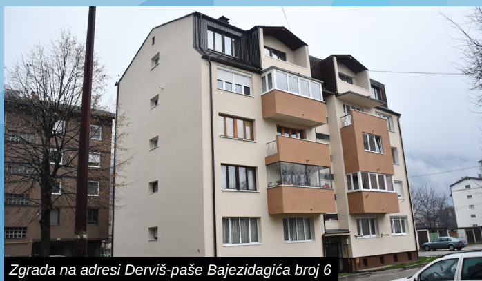
Zgrada na adresi Derviš-paše Bajezidagića broj 6

Nakon što je ranije utopljena zgrada na broju 3, u ulici Derviš-paše Bajezidagića, i zgrada na broju 6 novom fasadom dobila je posve novi izgled. Osim ovih objekata kolektivnog stanovanja projekt utopljanja pod nazivom "Za novo lice Ilidže" realizovan