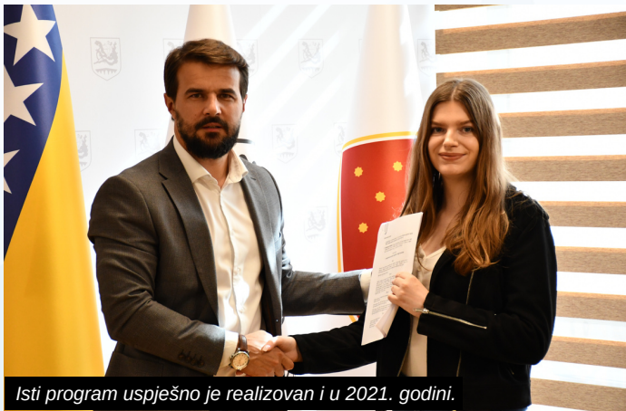
Isti program uspješno je realizovan i u 2021. godini.