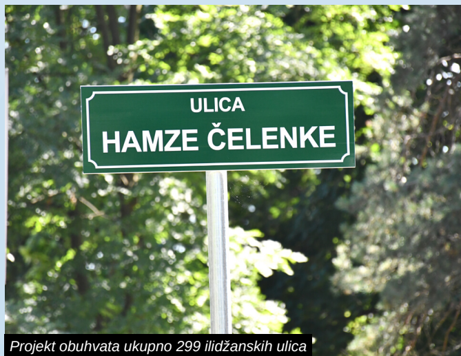
Projekt obuhvata ukupno 299 ilidžanskih ulica

Općina Ilidža je u septembru 2021. godine uspješno krenula u pilot projekt postavljanja putokaza s nazivima ulica.