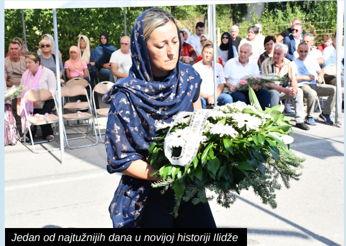
Jedan od najtužnijih dana u novijoj historiji Ilidže

Učenjem Fatihe i polaganjem cvijeća u Lasici obilježena je 30. godišnjica Bitke za Famos, te je odata počast svim šehidima i borcima poginulim u ovoj akciji, ali i svima koji su položili živote za odbranu slobodnih ilidžanskih prostora, Sarajeva i Bosne i Hercegovine.