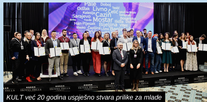
KULT već 20 godina uspješno stvara prilike za mlade

Inače, Institut za razvoj mladih KULT već 20 godina uspješno stvara prilike za mlade kako bi unaprijedili svoj položaj u društvu.