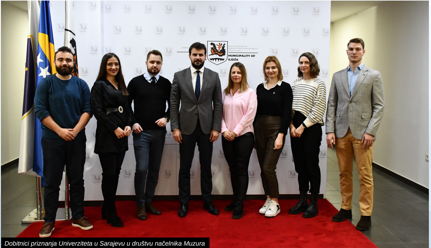
Dobitnici priznanja Univerziteta u Sarajevu u društvu načelnika Muzura

Osim dobitnika zlatnih i srebrenih znački UNSA, Općina Ilidža nagradila je i 50 učenika osnovnih i srednjih škola, kao i ilidžanske sportiste za ostvarene vrhunske rezultate na međunarodnoj sceni